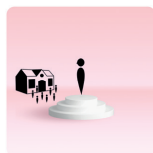
De leerling en de school