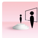
De leerling en de leerkracht