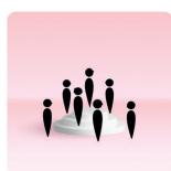
De leerling en de klas