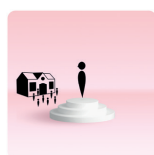
De leerling en de school