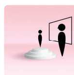
De leerling en de leerkracht