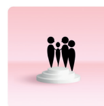
De leerling en het gezin

Door onderstaande vragen te stellen krijg je een beeld of de leerlingen hun thuiscultuur herkennen in relatie tot.